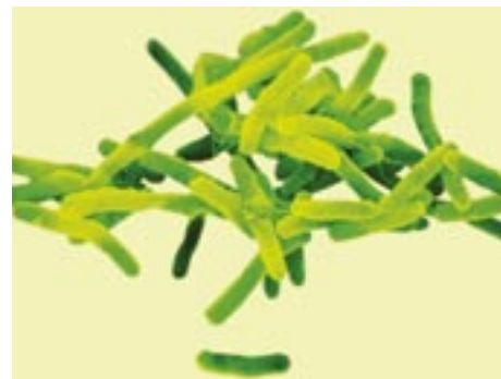
Hunderte unterschiedlicher Bakterien gehören in den gesunden Darm: Sie schützen vor chronischen Entzündungen

Um die positive Funktion der Milchsäurebakterien weiß die Medizin seit fast hundert Jahren – seit der Bakteriologe Ilja Metschnikoff herausfand, dass diese Joghurt-Bestandteile natürliche Abwehrkräfte des Körpers zu stärken und krankheitserregende Keime im